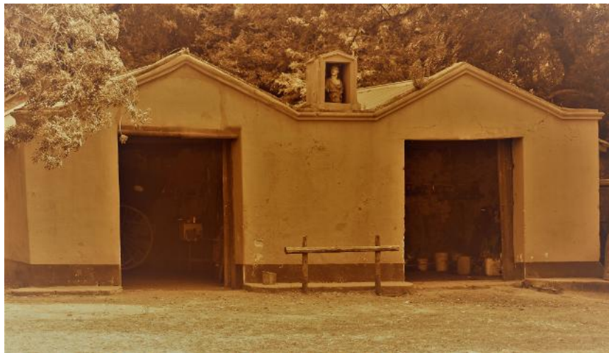
Imagen del galpón anexo al casco de la Estancia El Durazno 451

Respecto de la escasez de mano de obra en la campaña, según los datos del censo de 1854, el número de peones promedio por estancia era realmente bajo en este período. Incluso un conjunto importante de explotaciones eran atendidas por sus dueños o encargados, sobre todo, las medianas y pequeñas.