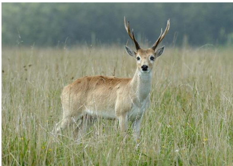
Imagen Venado de las Pampas 18

Dichos autores señalan también que los ciervos siempre han tenido un enorme valor carismático y por eso han atraído siempre la atención del hombre, por su belleza, gracia y velocidad, su valor como pieza de caza y los múltiples recursos que ha ofrecido al cazador recolector y posteriormente a españoles y criollos, que han hecho de ellos animales apreciados y, también por eso, muy perseguidos.