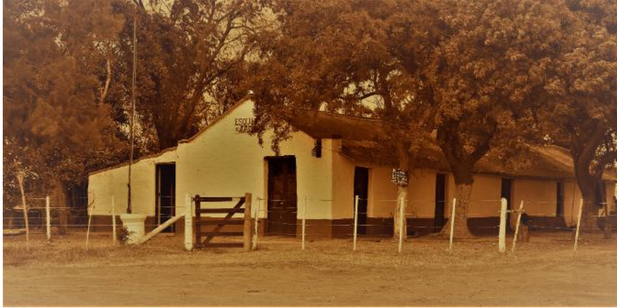
Imagen exterior de la pulpería Esquina de Argúas 467