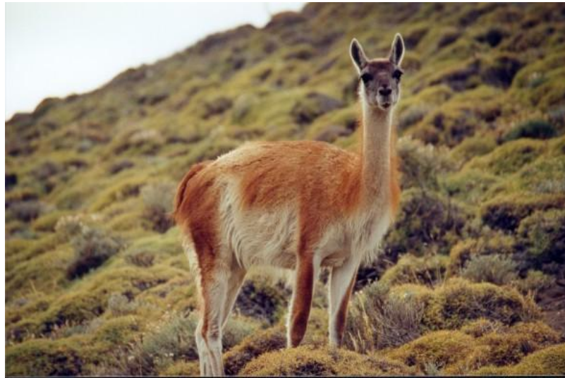
Imagen Guanaco 15

promedia 100 kg., si bien puede llegar hasta los 120-130 kg y su altura varía entre 1 a 1,20 metros y el largo corporal –de nariz a cola- puede alcanzar hasta 2 metros. El pelaje varía de marrón rojizo a un amarillo arcilloso y el pecho, vientre y entrepierna es blanco; la cabeza presenta distintos tipos de grises con zonas más claras alrededor de los ojos y la base de las cejas. Su estructura social es la de grupos familiares, generalmente con un macho líder y entre 5 a 15 hembras con sus crías. 14