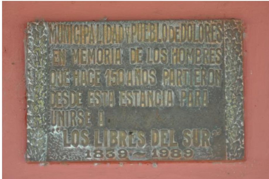
Imágenes tomadas del frente del primer casco de la Estancia El Durazno 366

Volviendo a los hechos, arreglados los planes, los conspiradores comenzaron a hacer propaganda en las boleadas y las carreras donde se concentraba el gauchaje, desde Pozo del Fuego a las puntas de Kakel, donde dominaban los Ramos Mejía. Por todas partes se usaba el color verde y celeste, símbolo unitario, mientras ejemplares del periódico El grito argentino , editado en Montevideo contra Rosas, circulaba en las pulperías, en las carretas y en las tiendas de los oficiales de milicias. 367