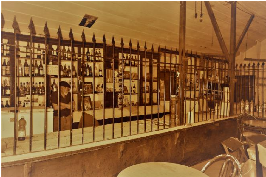
Imagen interior de la pulpería Esquina de Argúas 468