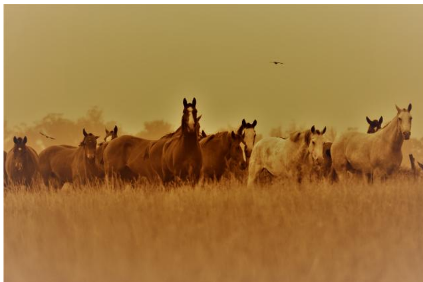
Imagen caballos Estancia El Durazno 460

Como ejemplo de esa importancia estratégica del caballo, se encuentra la carta que envía el Coronel Benito Machado, Jefe del Regimiento N° 14 de Guardias Nacionales, fechada en Tandil el 22 de noviembre de 1857 al Prefecto del Departamento N° 6, Juan Elguera, en la que le solicita disponer que los comisarios de las secciones de Lobería y Mar Chiquita remitan a la mayor brevedad los caballos patrios disponibles para su regimiento. 459