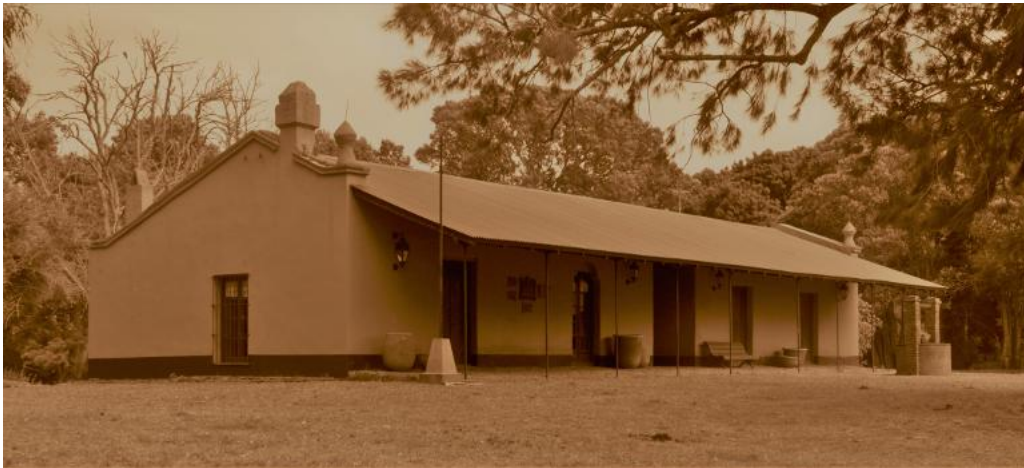
Imagen del primer casco de la Estancia El Durazno 450

previas, resultando los propietarios de estos establecimientos las máximas autoridades por entonces.